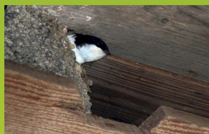
MESTNA LASTOVKA Delichon urbicum