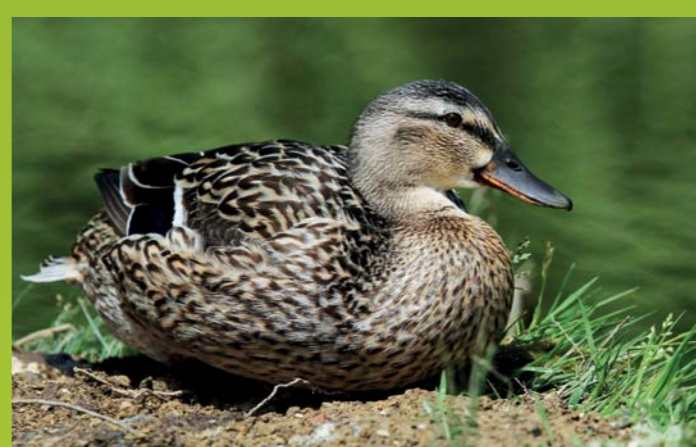
MLAKARICA Anas platyrhynchos