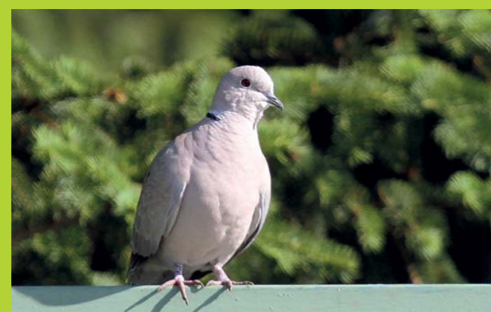
TURŠKA GRLICA Streptopelia decaocto