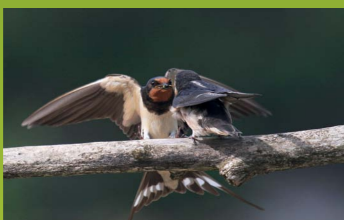
KMEČKA LASTOVKA Hirundo rustica