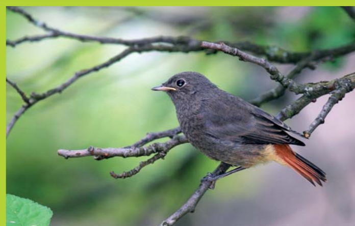
ŠMARNICA Phoenicurus ochruros