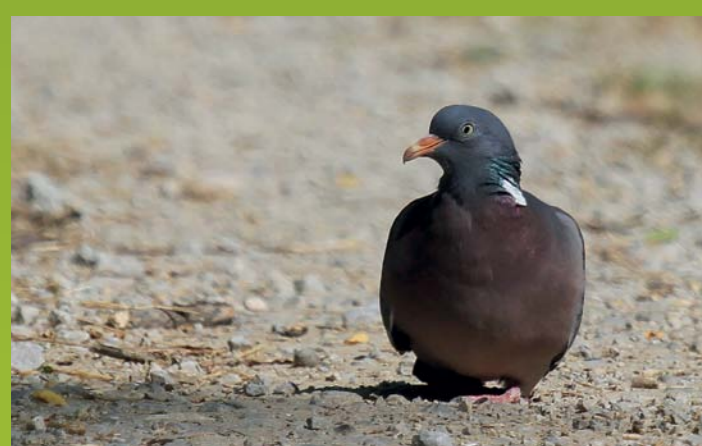
GRIVAR Columba palumbus