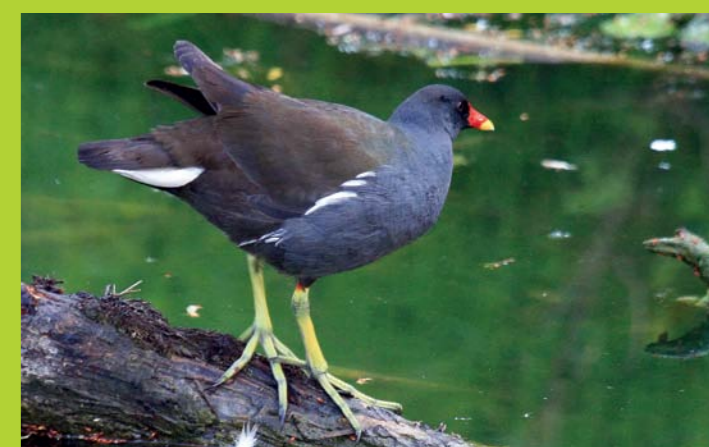
ZELENONOGA TUKALICA Gallinula chloropus

Na območju Slovenije se po podatkih Društva za opazovanje in proučevanje ptic Slovenije nahaja 380 prostoživečih vrst ptic (l. 2012), ki so bile potrjeno opažene na ozemlju Slovenije med leti 1800 in 2011. Poleg teh pa je še 35 vrst, ki so bile v naravo vnešene umetno in v Sloveniji niso vzpostavile prostoživeče populacije. Ptice so najbolj priljubljena skupina živali, kojih srečujemo vsakodnevno. Pritegnejo nas s svojim oglašanjem, videzom in sposobnostjo – letenjem. Kot simboli v kulturi, umetnosti in religiji igrajo pomembno vlogo v večini človeških kultur. Več o tem si lahko preberete na: https://sl.wikipedia.org/wiki/Seznam_ptic_v_Sloveniji in http://ptice.si/ .