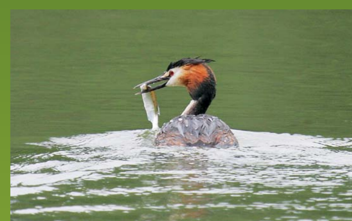
ČOPASTI PONIREK Podiceps cristatus