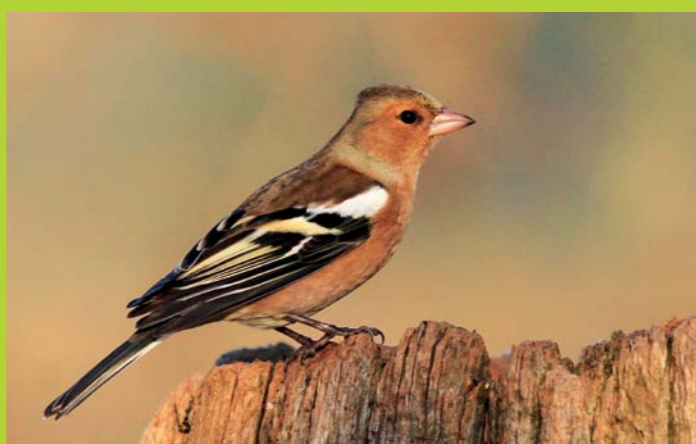
ŠČINKAVEC Fringilla coelebs