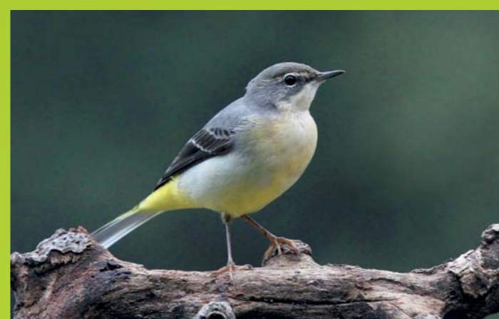
SIVA PASTIRICA Motacilla cinerea