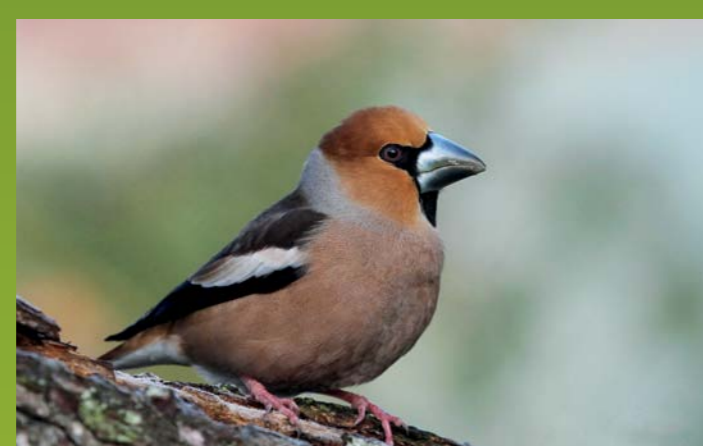
DLESK Coccothraustes coccothraustes