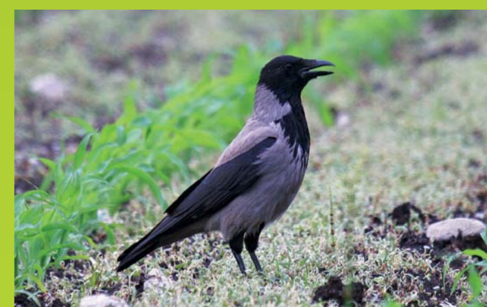
SIVA VRANA Corvus cornix