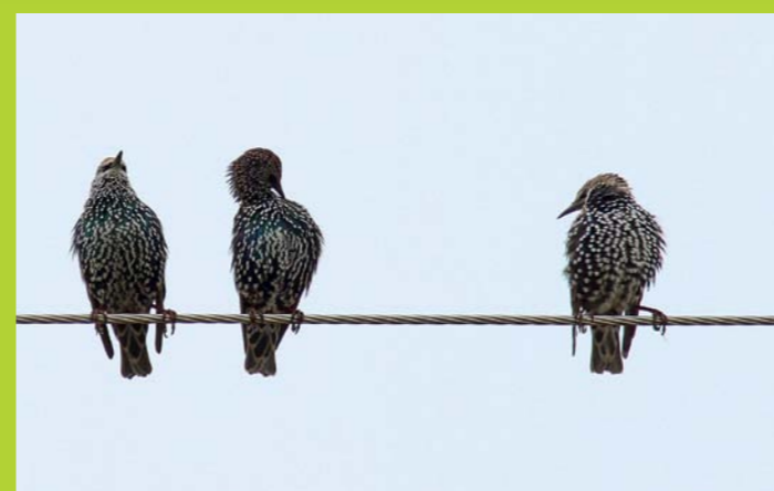
ŠKOREC Sturnus vulgaris