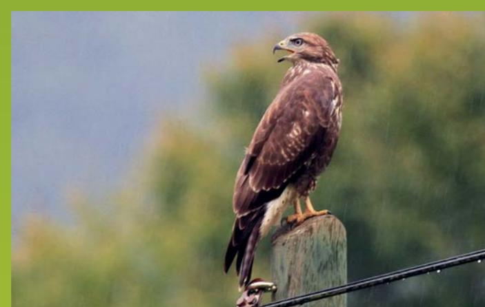
KANJA Buteo buteo