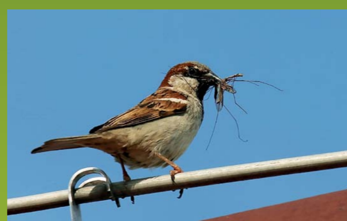
DOMAČI VRABEC Passer domesticus