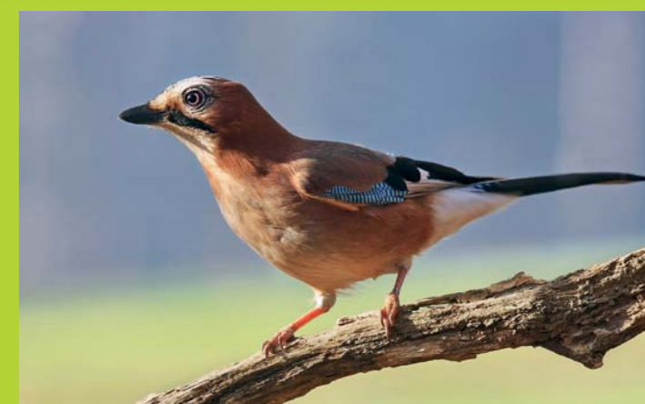
ŠOJA Garrulus glandarius