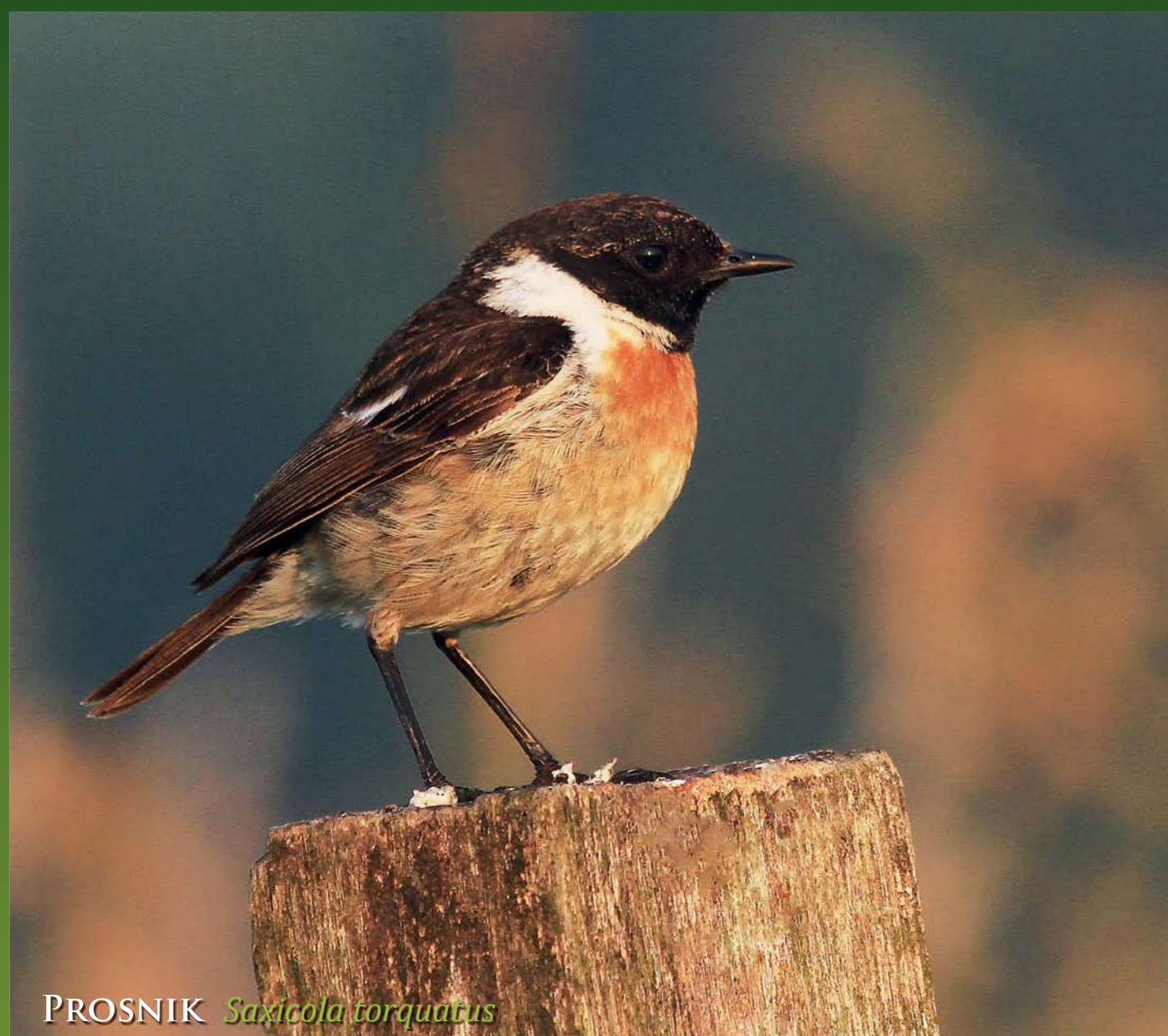
PROSNIK Saxicola torquatus