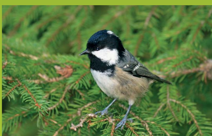
MENIŠČEK Pariparus (Parus) ater