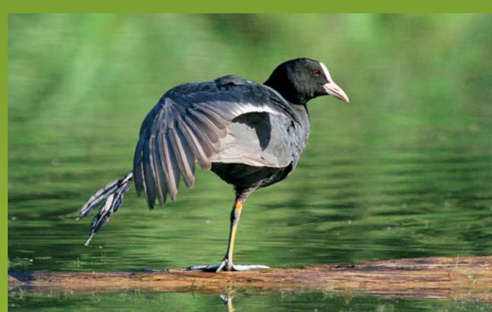
ČRNA LISKA Fulica atra