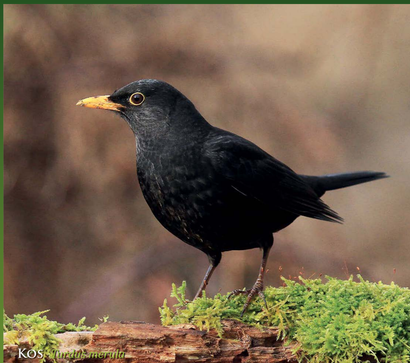
KOS Merula merula