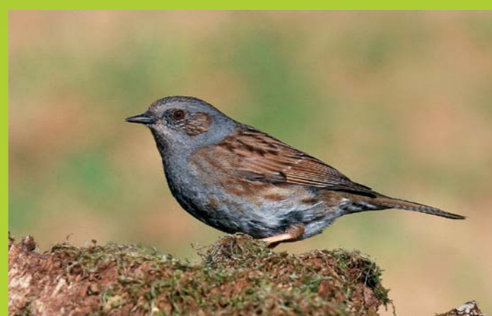
SIVA PEVKA Prunella modularis