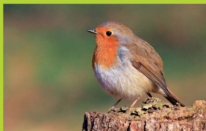
TAŠČICA Erithacus rubecula