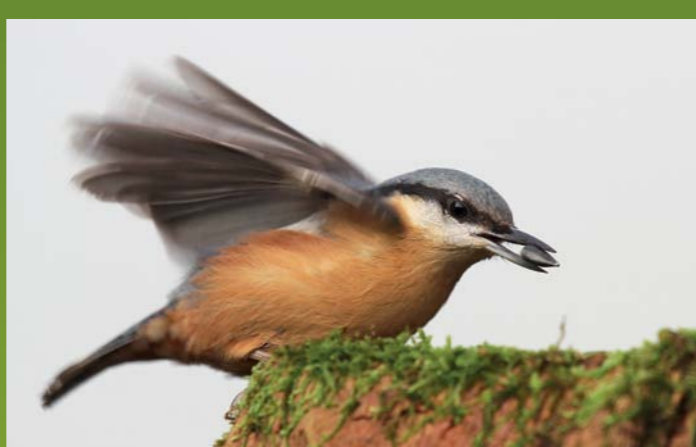
BRGLEZ Sitta europaea