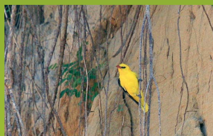
KOBILAR Oriolus oriolus