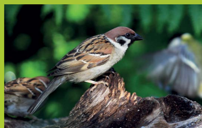
POLJSKI VRABEC Passer montanus