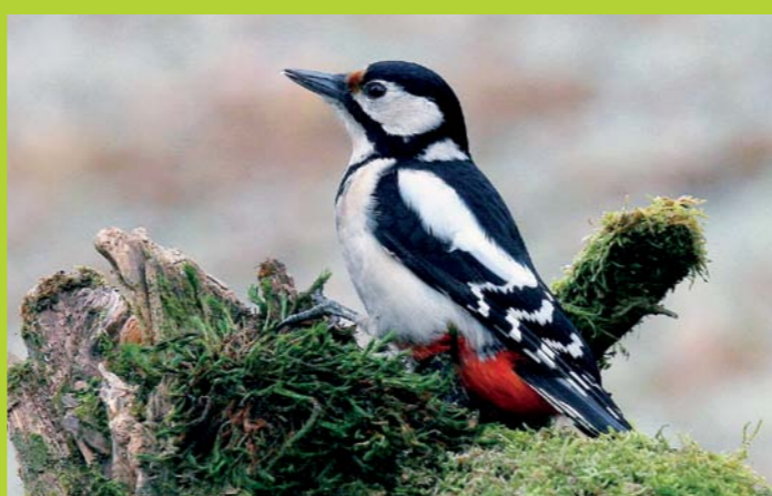
VELIKI DETEL Dendrocopos major