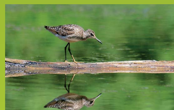
MOČVIRSKI MARTINEC Tringa glareola