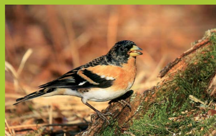
PINOŽA Fringilla montifringilla