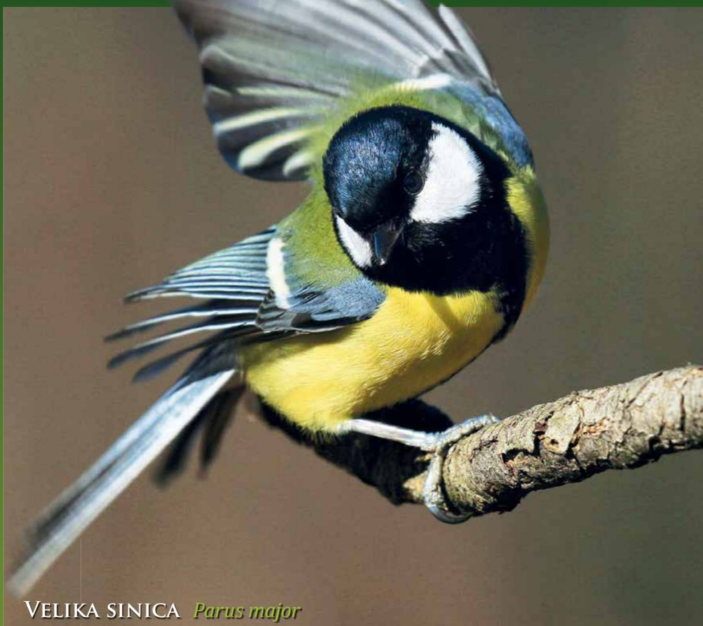
VELIKA SINICA Parus major