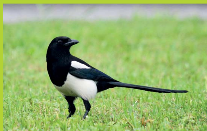
SRAKA Pica pica