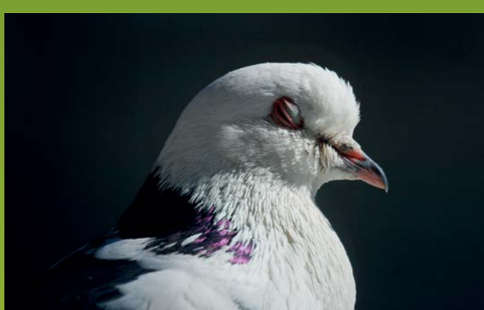
DOMAČI GOLOB Columba livia f. domestica