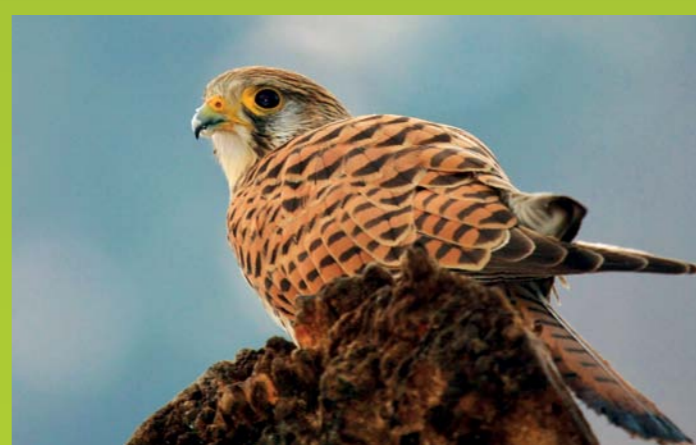
POSTOVKA Falco tinnunculus