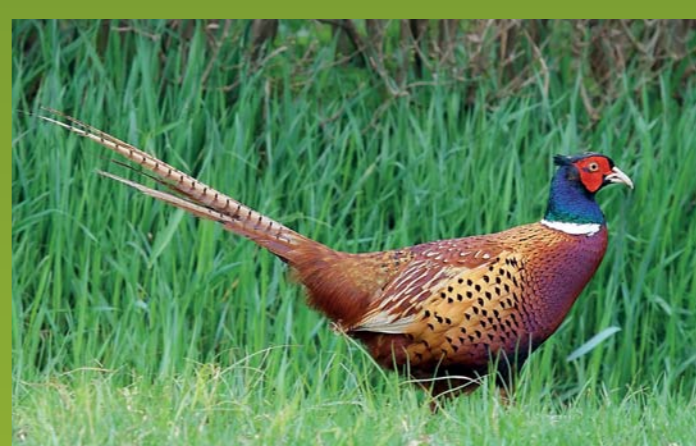
FAZAN Phasianus colchicus