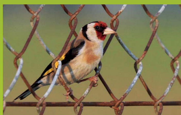
LIŠČEK Carduelis carduelis