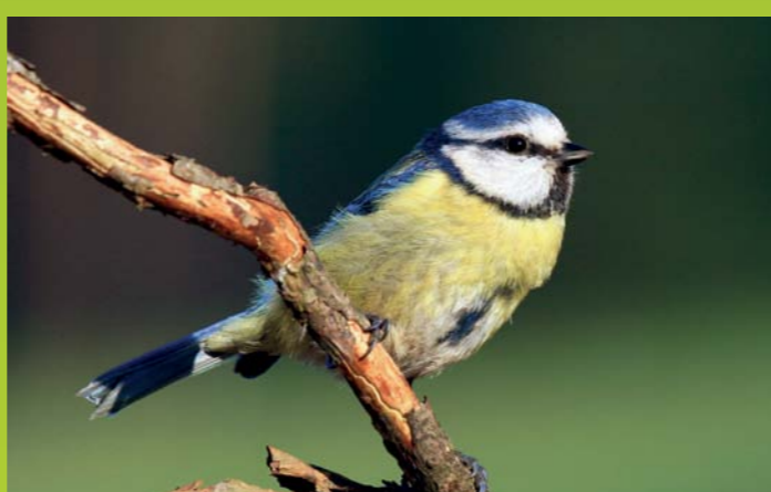
PLAVČEK Cyanistes (Parus) caeruleus