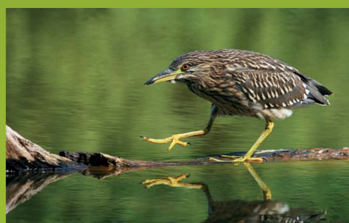
KVAKAČ (MLADOSTNI) Nycticorax nycticorax