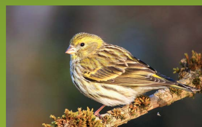
GRILČEK Serinus serinus