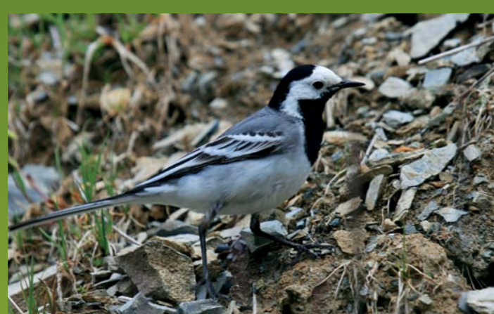
BELA PASTIRICA Motacilla alba