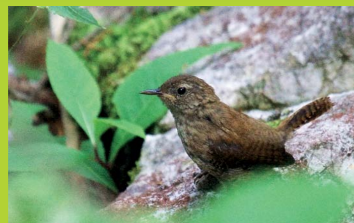
STRŽEK Troglodytes troglodytes