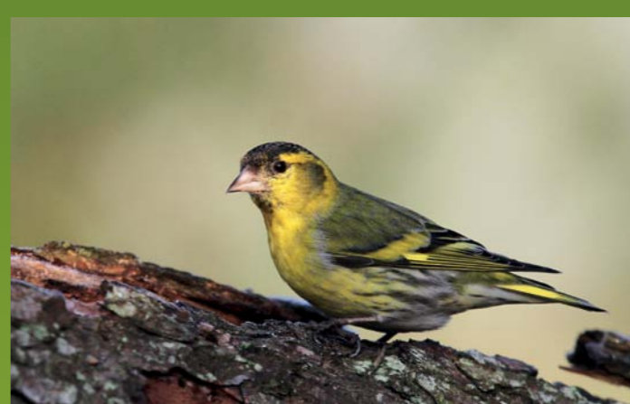
ČIŽEK Carduelis spinus