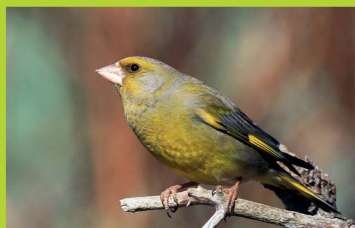
ZELENEC Carduelis chloris