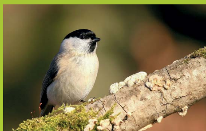
MOČVIRSKA SINICA Parus palustris