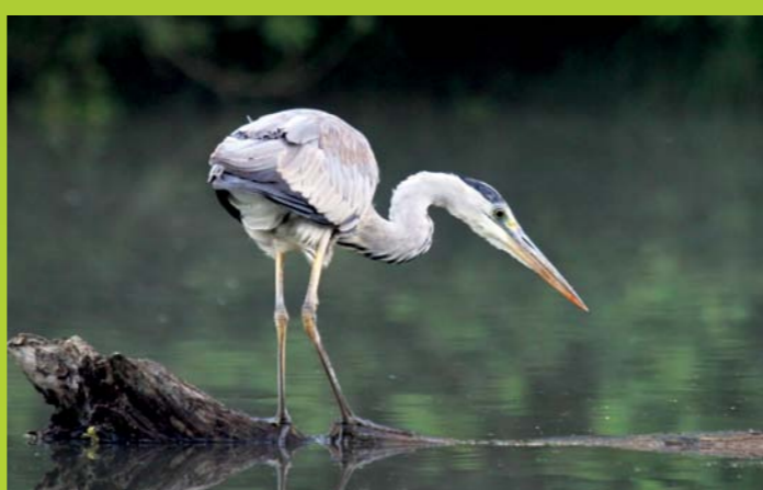
SIVA ČAPLJA Ardea cinerea