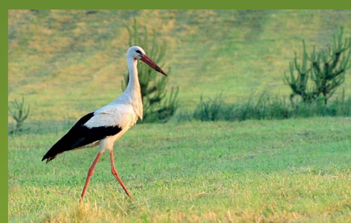
BELA ŠTORKLJA Ciconia ciconia