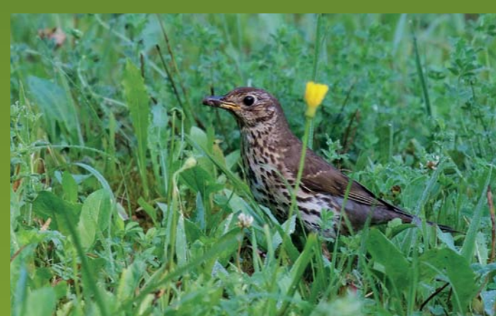
CIKOVT Turdus philomelos