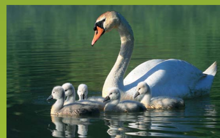
LABOD GRBEC Cygnus olor