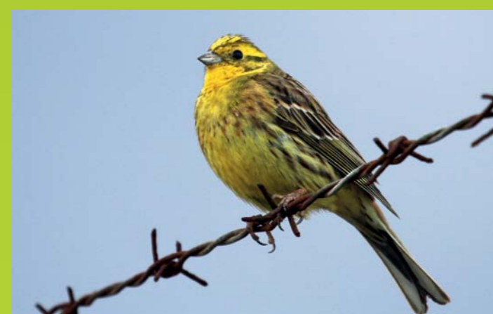
RUMENI STRNAD Emberiza citrinella