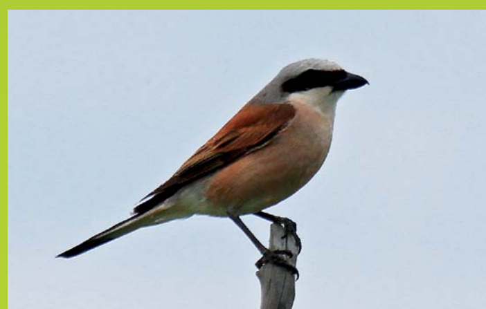
RJAVI SRAKOPER Lanius collurio