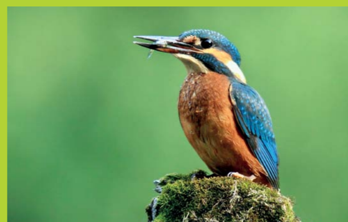
VODOMEC Alcedo atthis